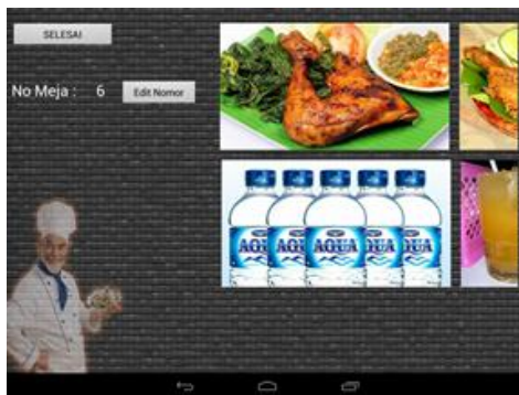
Gambar 3 Tampilan menu utama

Merujuk pada fungsi yang diinginkan sebelumnya dan perancangan yang sudah dilakukan sebelumnya maka berikut hasil implementasi aplikasi e-menu. Gambar 3 dan Gambar 4 memperlihatkan gambar screenshot dari tampilan menu utama dan deskripsi menu dari aplikasi e-menu.