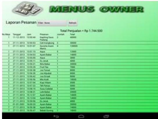
Gambar 7 Form pembukuan

Hasil implementasi aplikasi monitoring transaksi dapat dilihat pada Gambar 7 yang menunjukkan implementasi form pembukuan dari aplikasi monitoring transaksi dan pada Gambar 8 yang menampilkan implementasi form untuk merekap transaksi pada aplikasi monitoring transaksi.