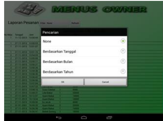
Gambar 8 Form rekap transaksi