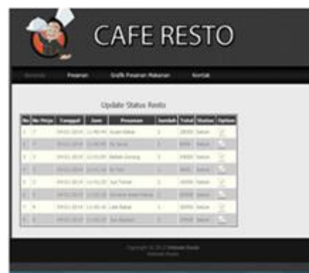
Gambar 6 Halaman pemesanan