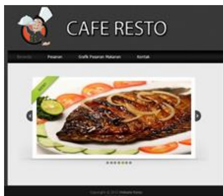
Gambar 5 Menu utama aplikasi dapur

Gambar 5 dan Gambar 6 menampilkan implementasi dari menu utama dan halaman pesanan dari aplikasi bagian dapur. Selain form-form tadi dibuat juga form untuk konfirmasi update status pesanan yang sudah selesai dikerjakan.