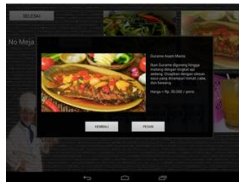
Gambar 4 Deskripsi menu