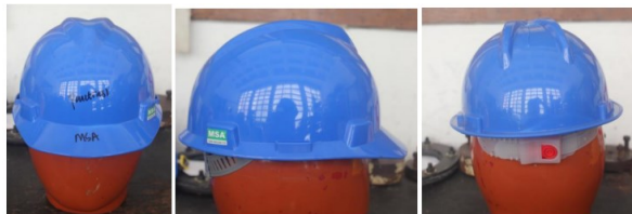
Gambar 2. Pengujian Helm Keselamatan Industri non SNI

Pada Uji redam kejut untuk perlambatan yang diteruskan pola kepala uji dibedakan menjadi tiga kondisi yaitu Suhu rendah – 10 °C, 4 jam dan Suhu tinggi (50 ± 2) °C, 4 jam serta Kondisi lembab