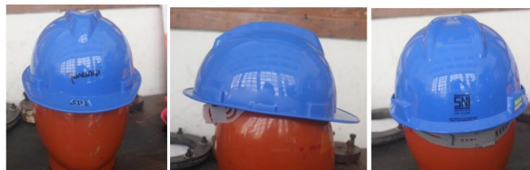
Gambar 1. Pengujian Helm Keselamatan Industri Merk SNI

Penelitian ini melakukan pengujian terhadap helm safety merk SNI maupun nonSNI di Balai Layanan Jasa Balai Besar Bahan dan Barang Teknik (B4T) di Bandung. Masing masing pengujian membutuhkan minimal 10 sampel helm sesuai dengan kelas atau warna helm keselamatan industri. Proses pengujian ditunjukkan pada gambar 1 dan 2 berikut.