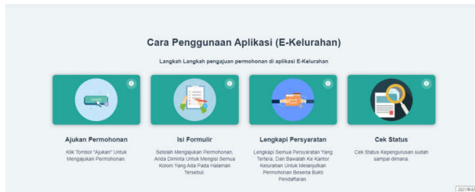
Gambar 2. Tampilan Menu Penggunaan

Menu Permohonan berfungsi untuk memilih surat/dokumen yang akan diurus melalui aplikasi e-kelurahan. Berikut ini adalah rincian jenis-jenis surat yang dapat diurus melalui aplikasi e-kelurahan di Kota Padang :