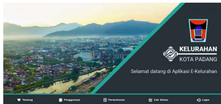
Gambar 1. Tampilan utama aplikasi e-kelurahan kota Padang

Aplikasi e-kelurahan kota Padang dapat diakses melalui https://ekelurahan.padang.go.id dengan tampilan awal seperti ditunjukkan oleh Gambar 1 dibawah ini.