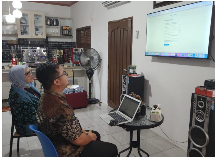
Gambar 2. Implementasi Google Sites

Gambar ini menunjukkan proses implementasi platform Google Sites yang dilakukan oleh tim pengabdian bersama pengelola LPK/LKP Palembang Training Center. Pada tahap ini, pengelola secara langsung mempraktekkan pembuatan dan pengelolaan website company profile dengan bimbingan dari fasilitator. Proses implementasi meliputi pembuatan struktur halaman, pengisian konten seperti profil lembaga, program pelatihan, jadwal kegiatan, serta pengaturan tampilan agar website sesuai dengan identitas dan kebutuhan lembaga. Penggunaan Google Sites yang intuitif memudahkan pengelola untuk mengupdate konten secara real-time dan mengelola informasi secara mandiri, sehingga diharapkan dapat meningkatkan efektivitas komunikasi lembaga dengan publik secara digital.