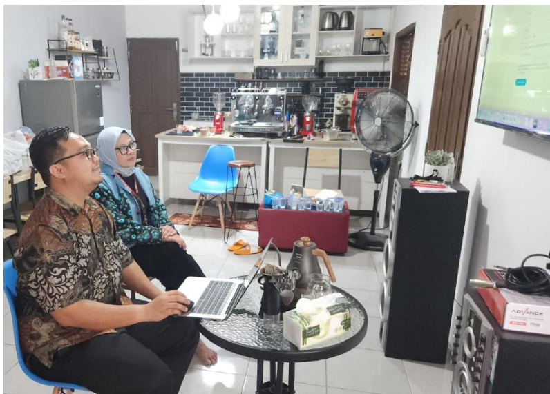
Gambar 1. Proses Diskusi dan Meninjau Konten

dilakukan secara intensif untuk memastikan setiap peserta memahami pemilih-langkah teknis dan prinsip penyajian informasi yang menarik dan mudah diakses. Proses pembuatan website dilakukan dengan pendekatan praktis dan interaktif. Peserta aktif berdiskusi dan bertukar pendapat mengenai tata letak, pemilihan gambar, dan penulisan konten yang sesuai dengan karakter LPK/LKP Palembang Training Center. Pada akhir sesi, setiap peserta berhasil mengunggah halaman profil yang sudah siap digunakan sebagai media komunikasi publik.