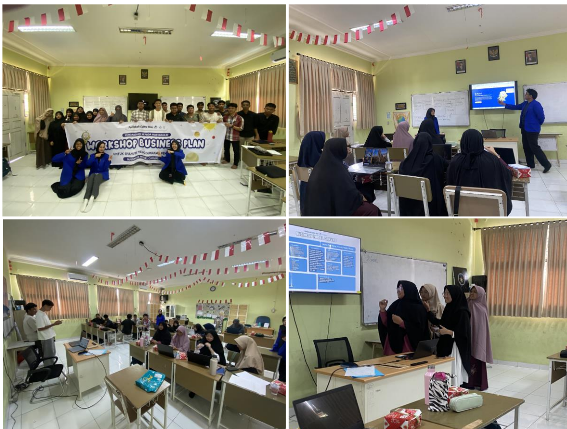
Gambar 3. Pelaksanaan Workshop Business Plan di SMAIT Al-Ittihad Rumbai

Selain berdampak pada peningkatan pemahaman siswa, kegiatan ini juga memberikan manfaat bagi mahasiswa yang terlibat sebagai fasilitator. Mahasiswa memperoleh pengalaman langsung dalam mendampingi siswa sekolah menengah, melatih kemampuan komunikasi, kepemimpinan, serta kerja tim. Interaksi antara mahasiswa dan siswa menciptakan proses pembelajaran dua arah yang saling memperkaya.