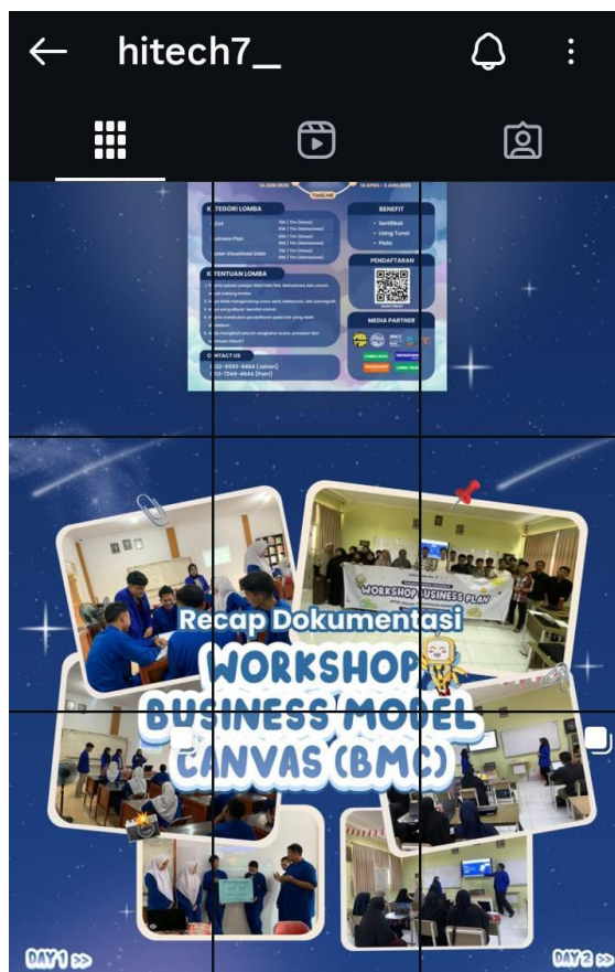
Gambar 4. Publikasi Kegiatan PkM pada Media Sosial Program Studi

Secara keseluruhan, hasil pelaksanaan workshop menunjukkan bahwa pendekatan Business Model Canvas yang dipadukan dengan metode pembelajaran berbasis praktik dan dukungan media digital mampu meningkatkan pemahaman dan keterampilan kewirausahaan siswa. Temuan ini sejalan dengan penelitian sebelumnya yang menyatakan bahwa BMC efektif digunakan sebagai alat pembelajaran kewirausahaan karena bersifat visual, sederhana, dan mudah dipahami oleh pemula. Dengan demikian, kegiatan ini tidak hanya memberikan manfaat langsung bagi siswa, tetapi juga berkontribusi dalam penguatan kolaborasi antara perguruan tinggi dan sekolah menengah dalam pengembangan pendidikan kewirausahaan.