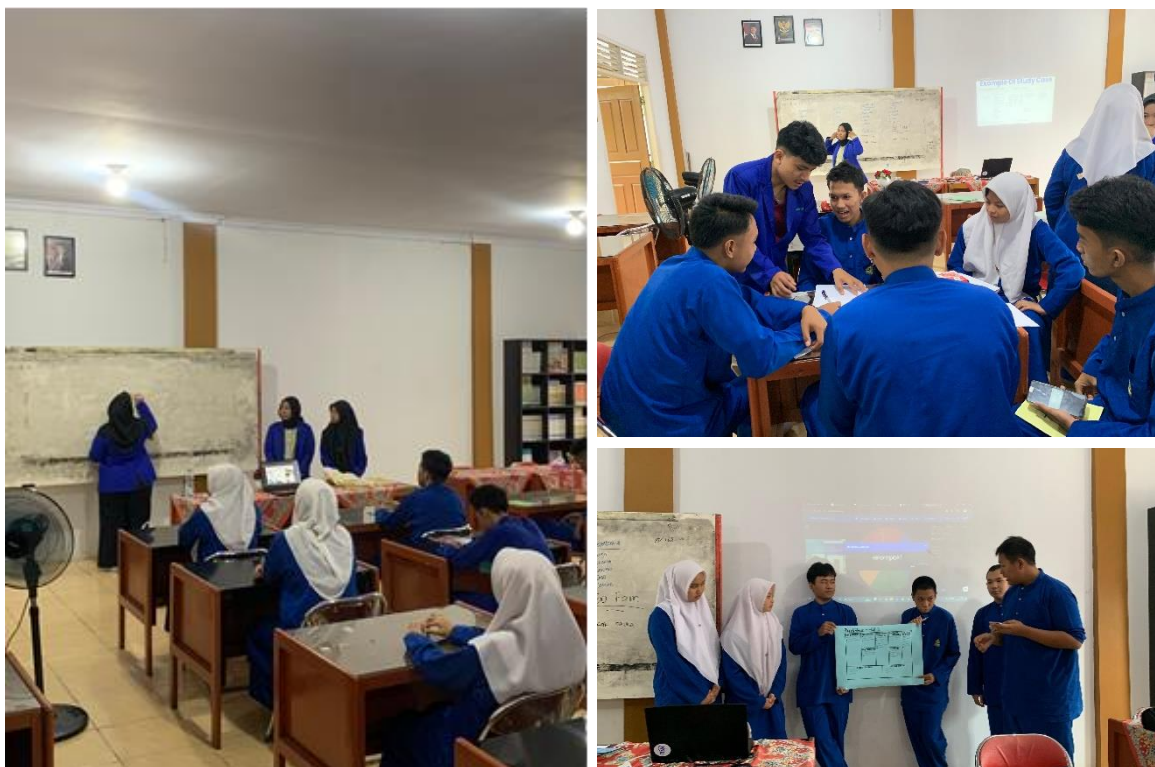
Gambar 2. Pelaksanaan Workshop Business Plan di SMK Labor Pekanbaru

Pada pelaksanaan kegiatan di SMK Labor Pekanbaru, siswa menunjukkan antusiasme tinggi dalam mengikuti setiap sesi workshop. Hal ini terlihat dari keaktifan siswa dalam diskusi kelompok serta keterlibatan mereka saat menyusun BMC menggunakan media digital dan media fisik. Dokumentasi pelaksanaan workshop di SMK Labor Pekanbaru dapat dilihat pada Gambar 1, yang menunjukkan aktivitas siswa saat berdiskusi dan mengisi elemen BMC secara kolaboratif.