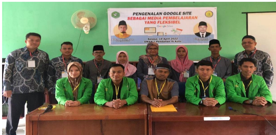
Gambar 2. Photo Bersama dengan Peserta.