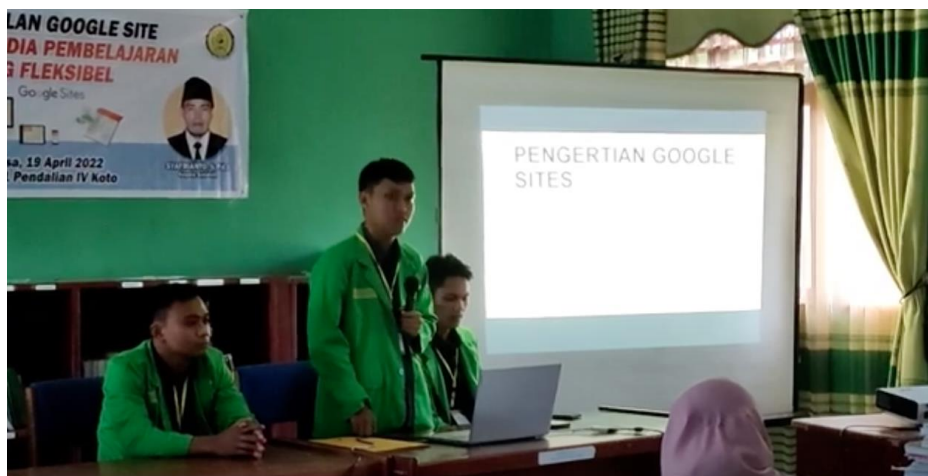
Gambar 3. Penyampaian Materi