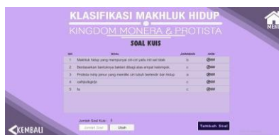
Gambar 6. Halaman untuk mengelola soal evaluasi

Pada menu Evaluasi, guru dapat mengelola soal evaluasi dengan melakukan login terlebih dahulu. Adapun halaman untuk mengelola soal oleh guru dapat ditunjukkan pada Gambar 6.