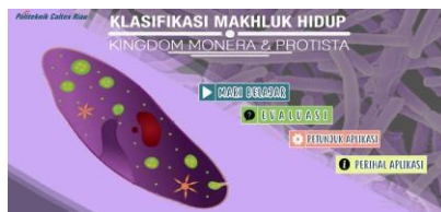
Gambar 3. Halaman utama aplikasi

Pada gambar 3 terdapat 4 tombol yang dapat digunakan oleh guru dan siswa, terdiri dari tombol Mari Belajar, Evaluasi, Petunjuk Aplikasi, dan Perihal Aplikasi. Video materi pada aplikasi ini terdapat di dalam menu Mari Belajar. Adapun halaman video materi dapat ditunjukkan pada Gambar 4.