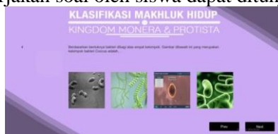
Gambar 7. Halaman pengerjaan soal evaluasi

Pada menu Evaluasi, siswa dapat mengerjakan soal yang diberikan oleh guru. Adapun halaman untuk mengerjakan soal oleh siswa dapat ditunjukkan pada Gambar 7.