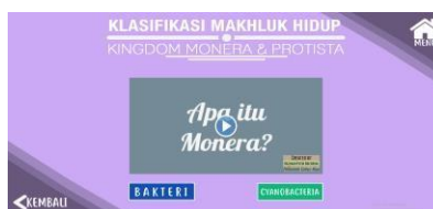
Gambar 4. Halaman video materi

Pada gambar 3 terdapat 4 tombol yang dapat digunakan oleh guru dan siswa, terdiri dari tombol Mari Belajar, Evaluasi, Petunjuk Aplikasi, dan Perihal Aplikasi. Video materi pada aplikasi ini terdapat di dalam menu Mari Belajar. Adapun halaman video materi dapat ditunjukkan pada Gambar 4.