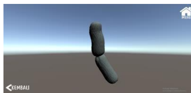
Gambar 5. Halaman model tiga dimensi

Selain materi yang disajikan dalam bentuk video, aplikasi ini menampilkan model tiga dimensi dari beberapa contoh kingdom monera dan Protista yang dapat ditunjukkan pada Gambar 5.